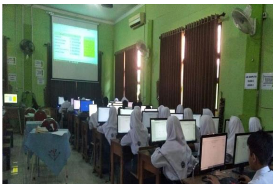
Gambar 4 Tes Observasi Kemampuan Berhitung Siswa Kelas 7

disusun oleh operator. Untuk memperlancar pelaksanaan tugas ini, pada klinik matematika disiapkan user manual penggunaan thatquiz untuk pembuatan soal pre-test, latihan soal, soal pretes. Cara ini ternyata lebih efektif dan efisien.