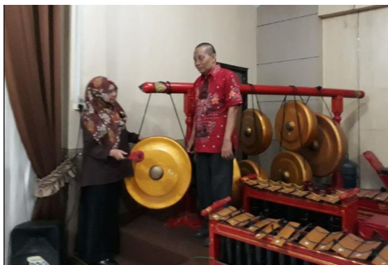
Gambar 1. Pembukaan Workshop Klinik Matematika

Pada workshop ini juga dihasilkan alur layanan klinik yang diberikan dalam diagram di bawah ini.