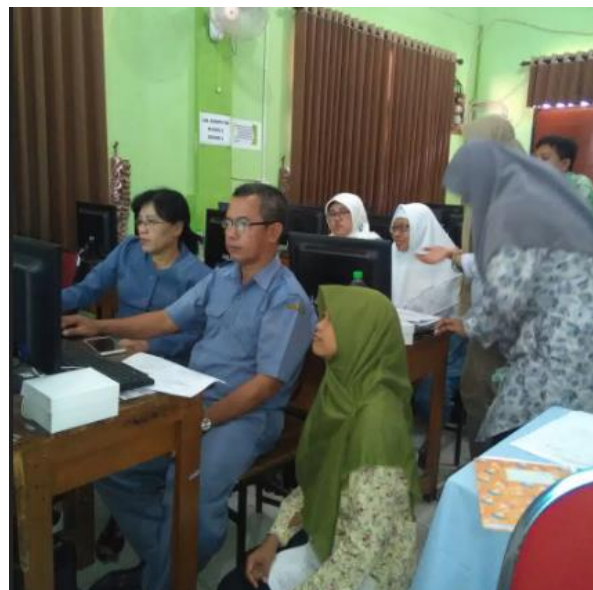
Gambar 3 Peserta berlatih membuat media pembelajaran berbasis thatquiz Pada workshop ini guru dilatih menggunakan thatquiz untuk membuat kelas sesuai dengan kelas yang diampu dan tes baik untuk pre-test, latihan, maupun post-test.

Workshop ini dilaksanakan pada tanggal 7 Mei 2018 bertempat di SMPN 7 Surabaya dengan diikuti oleh guru SMPN 7 Surabaya. Pada workshop peserta dilatih membuat media pembelajaran berbasis thatquiz .